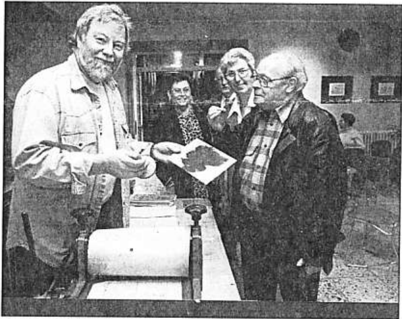
Dolf Wagener (li.) stellt noch bis zum 14. April im Rathaus aus.

Radierungen des Künstlers Dolf Wagener sind noch bis 14. April im Homberger Bezirks-Rathaus am Bismarckplatz zu sehen. „Im Umkreis von 50 Kilometern rund um Homberg habe ich meine Motive gefunden“, erklärt der Künstler. Zu sehen sind Dörfer, Städte, Plätze und Kirchen aber auch Industrieanlagen. „Motive vom Niederrhein von A wie Alpen bis Z wie Xanten gibt es in der Ausstellung zu sehen. Vieles wird Ihnen bekannt vorkommen“, so Wagener. Mehr als 200 Motive hat Dolf Wagener in den vergangenen 20 Jahren abgebildet. Am ganzen Niederrhein hat er beinahe jede Stadt besucht. Unter den Bildern im Homberger Rathaus ist auch der „Brunnen am Bismarckplatz“, ein neues Bild des Künstlers.